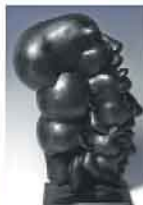
Karel From, „Zur Sonne a. d. Isar“ i.Or. München