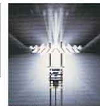
Reinhard Jahn, „Lessing zum flammenden Stern“ i.Or. München

Links: Ralph Dinkel, „Zu den 7 Rosen“ i.Or. Basel