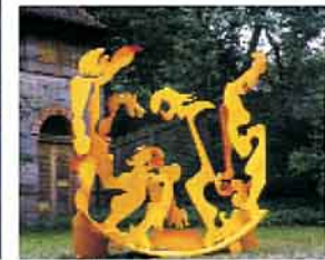
Stefan R. Schuetz, „Zu den drei Türmen“ i.Or. Rothenburg-Dinkelsbühl